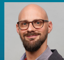
Thomas Herzog Akustik / Bauphysik