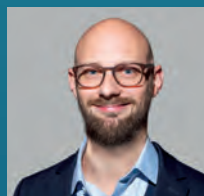
Thomas Herzog Akustik & Bauphysik