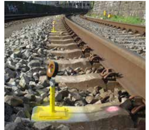
Titelseite: Drohnenaufnahme der Pauluskirche, Basel. Von der Punktwolke bis zur Dreiecksvermaschung. Oben links: Rheingasse, Basel: 3D-Scan (Punktwolke coloriert) der Bausubstanz nach Brand zur Bauwerksdokumentation Oben Mitte: Bau 2, F. Hoffmann-La Roche AG, Basel Bau- und Ingenieurvermessung Oben rechts: Baugrubenkontrolle mittels Falschfarbenvisualisierung Unten rechts: Grosspeter Tower, Basel: Überwachung Gleis und Bahntechnikanlage nach Regelwerk SBB I-50009