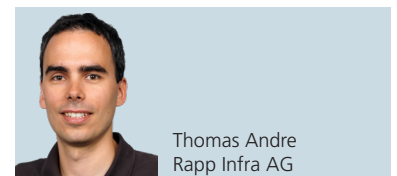
Thomas Andre Rapp Infra AG

Auf der Rückseite geben wir Ihnen einen Überblick zu unserem Leistungsangebot im Bereich Brandschutz.